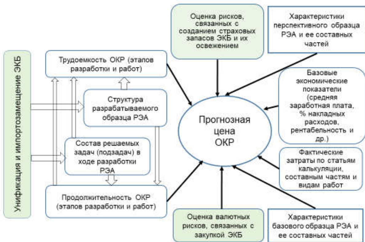
Рисунок 4 – Определение затрат (в постоянных ценах) на ОКР и отдельных этапов

Следует отметить, что определение затрат на выполнение ОКР и ее отдельных этапов носит комплексный характер (рисунок 4), состоящий в следующем: