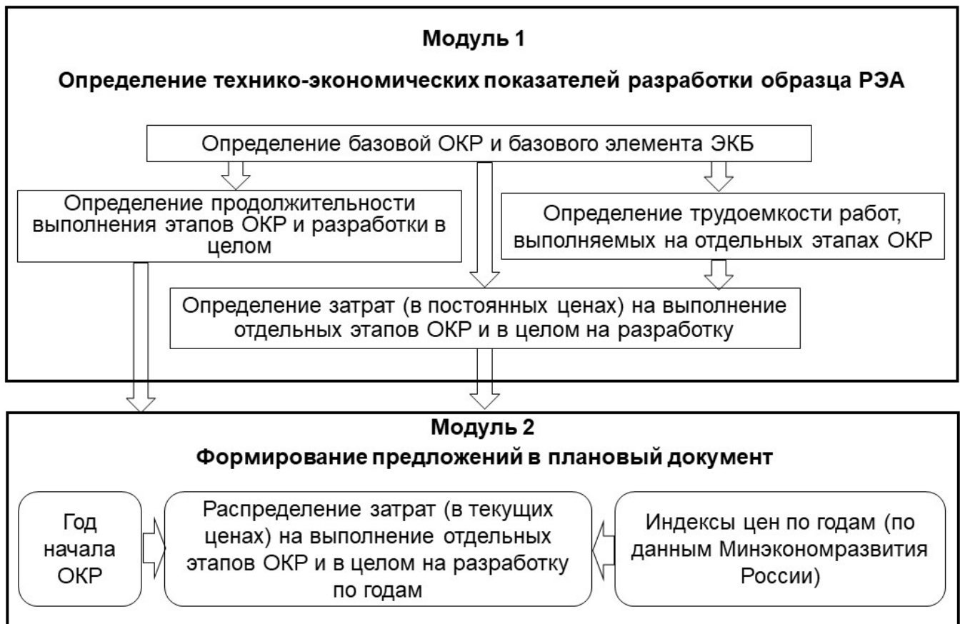
Рисунок 2 – Структура экономической модели выполнения ОКР

Кроме указанных составных частей первый модуль содержит блок, позволяющий определять базовую ОКР и базовый элемент ЭКБ, являющиеся ключевыми понятиями, используемыми для оценки технико-экономических показателей.