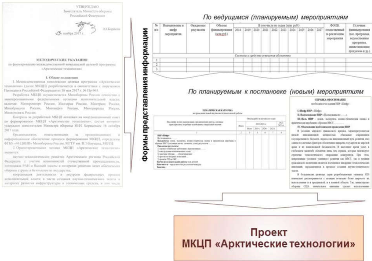
Рисунок 2 – Порядок формирования МКЦП «Арктические технологии»

ванию, которые определяют цели, задачи, сроки реализации, а также порядок подготовки предложений в проект программы (рисунок 2). Указанные методические указания разработаны УПМИ и СП совместно с ФГБУ «46 ЦНИИ» Минобороны России, утверждены заместителем Министра обороны Ю.И. Борисовым 13 ноября 2017 года и разосланы в заинтересованные ФОИВ.