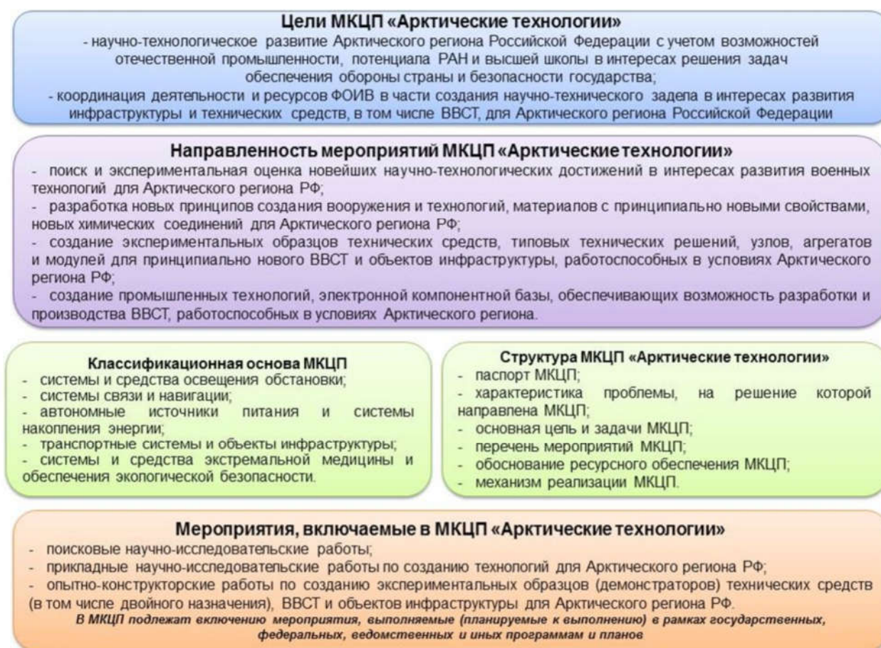
Рисунок 1 – Характеристика МКЦП «Арктические технологии»

Для координации деятельности и ресурсов федеральных органов исполнительной власти в части создания научно-технического задела в интересах развития инфраструктуры и технических средств, в том числе вооружения, военной и специальной техники, для Арктического региона Российской Федерации, УПМИ и СП организована работа по формированию межведомственной комплексной целевой программы «Арктические технологии» (МКЦП «Арктические технологии») (рисунок 1).