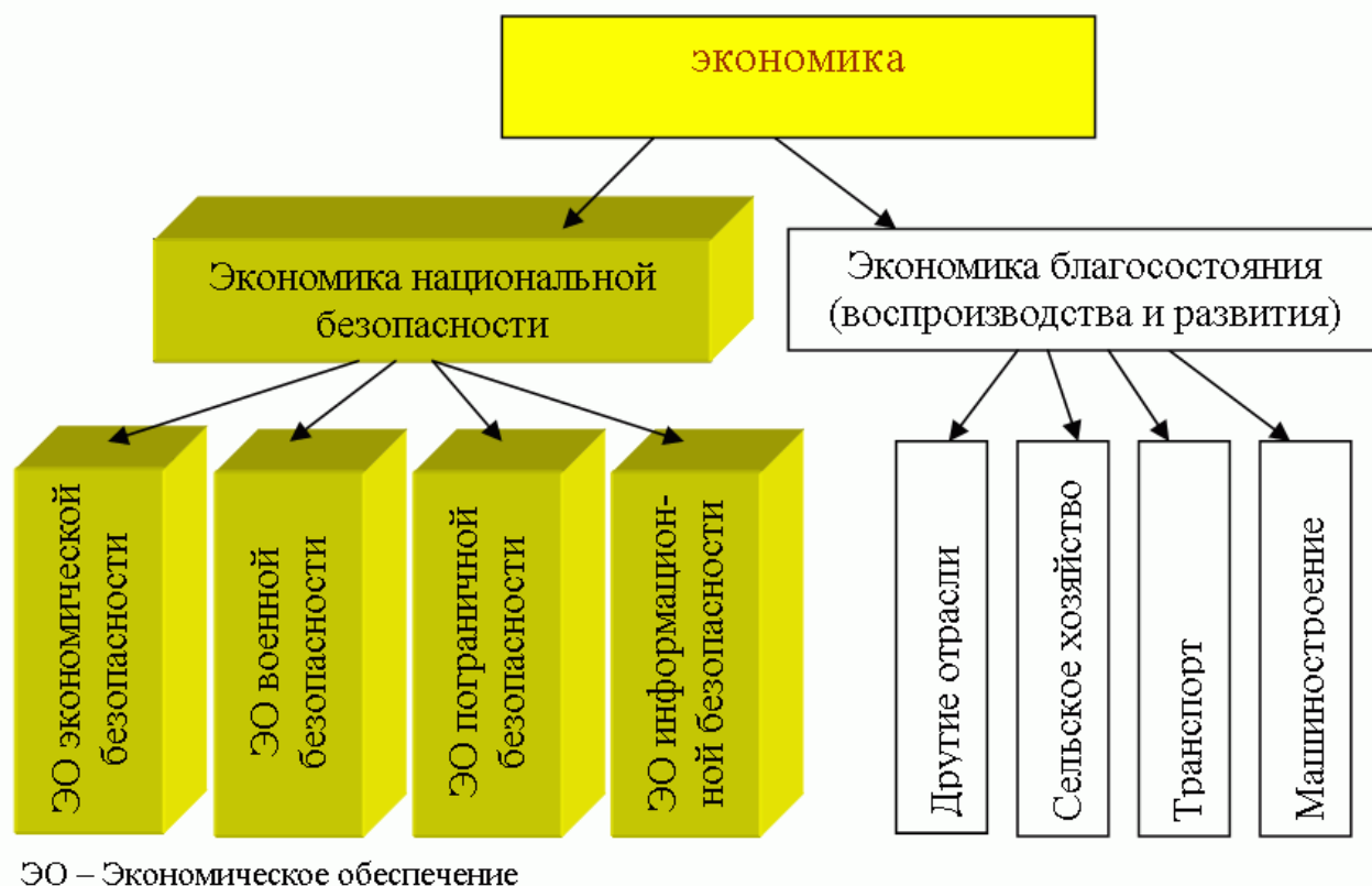
Рисунок 1 – Экономика безопасности

Итак, реально существует экономика национальной безопасности как определенная система экономических отношений и совокупность экономических структур, обслуживающих функционирование различных систем безопасности. Схематически она представлена на рисунке 1.